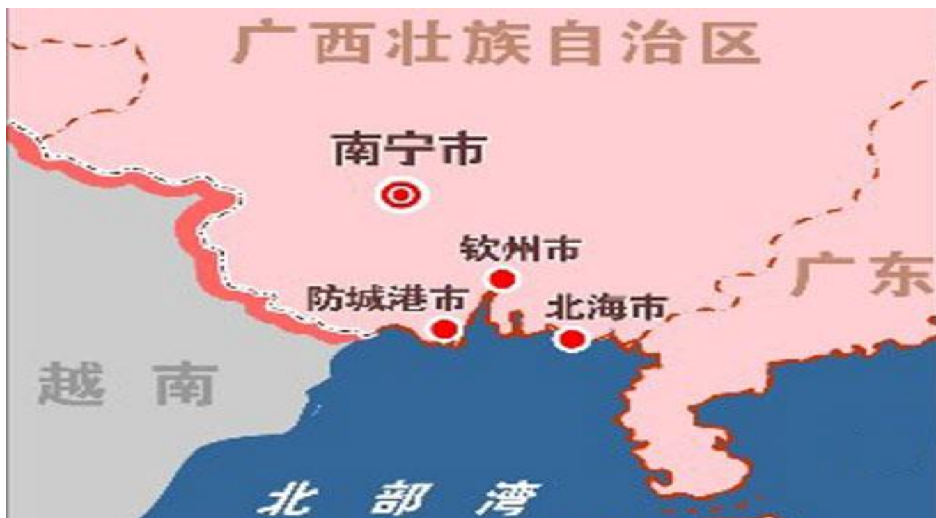
(广西北部湾经济区)

2009年2月5日，國務院發佈《關於推進重慶市統籌城鄉改革和發展的若干意見》。重慶市是中西部地區唯一的直轄市，是全國統籌城鄉綜合配套改革試驗區，在促進區域協調發展和推進改革開放大局中具有重要的戰略地位。重慶市集大城市、大農村、大庫區、大山區和民族地區於一體，城鄉二元結構矛盾突出，老工業基地改造振興任務繁重，統籌城鄉發展任重道遠。推進重慶市統籌城鄉改革發展的戰略任務是“一圈兩翼”開發、擴大內陸開放、產業優化升級、科教興渝支撐、及資源環境保障。