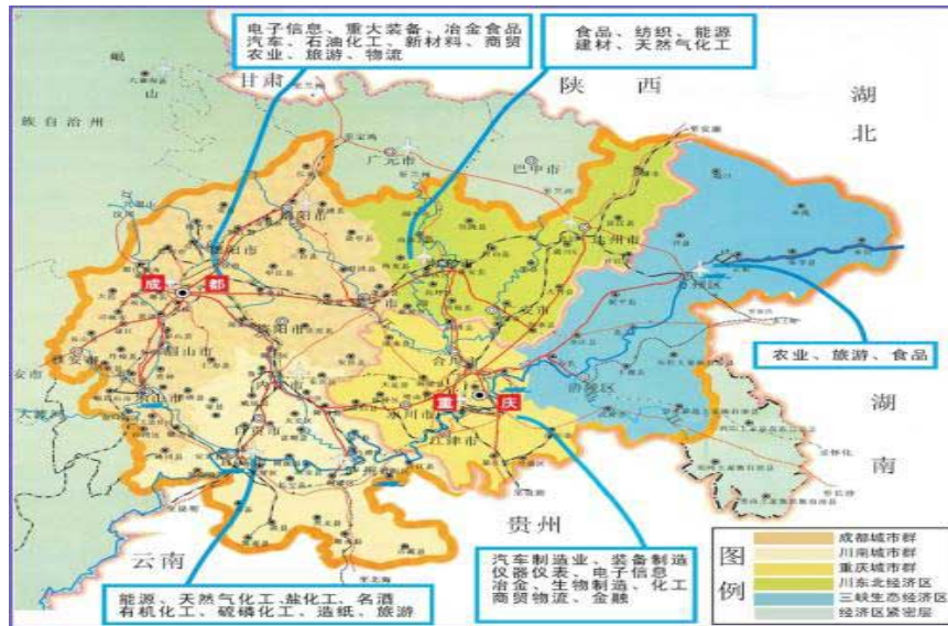
(成渝全國統籌城鄉綜合配套改革試驗區)

2007年6月，國家發展和改革委員會發出通知，批准重慶市和成都市設立全國統籌城鄉綜合配套改革試驗區。四川和重慶集中了上億的人口。通過設立這樣一個試驗區，將解決內需問題、發展問題、環境問題，以及一些體制性障礙。