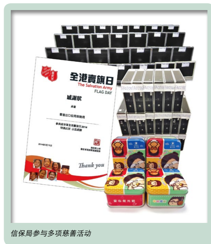
信保局参与多项慈善活动

信保局一如既往采取措施，减量、重用及循环再用，致力保护环境。本局于购买办公室设备及机器时，尽量实行「绿色采购」政策，并制定了减低资源消耗的目标。为达成目标，信保局定期提醒员工，在日常运作循环再用资源，减少能源及纸张的消耗，同时采纳员工就推动环境保护的有关建议。本局和全体员工齐心协力建立绿色的办公室。