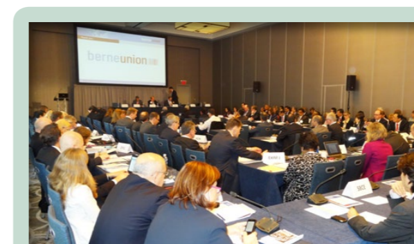
信用保险业国际总会春季会议在2013年4月于纽约举行

继续担任该职位。信保局亦在非正式的地区合作小组扮演活跃角色。该小组由来自澳洲、中国内地、印度、印尼、日本、马来西亚、斯里兰卡、南韩、台湾、泰国及香港的亚太区出口信用保险机构组成。