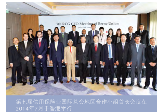
第七届信用保险业国际总会地区合作小组首长会议在2014年7月于香港举行

信保局亦在信用保险业国际总会非正式地区合作小组扮演活跃角色。该小组由来自澳洲、中国内地、印度、印尼、日本、马来西亚、斯里兰卡、南韩、台湾、泰国及香港的亚太区出口信用保险机构组成。除了参加与信用保险业国际总会会议同期举行的地区合作小组会议及在印度孟买