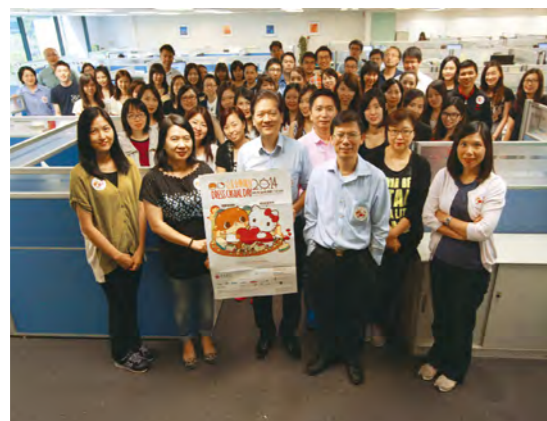
信保局参与「公益金便服日」

信保局参与慈善及义工服务，贡献社群，矢志肩负企业社会责任。年度内，信保局参加了多项筹款活动，包括「公益金便服日」、「奥比斯中秋慈善义卖」和「扶康会全港卖旗日」等，支援有需要人士。其他善举包括捐血活动、捐赠旧衣、旧电脑及相关设备予慈善机构。员工热情投入上述活动，著实令人鼓舞。