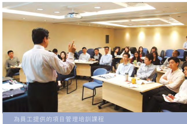
為員工提供的項目管理培訓課程

及個人資料私隱相關法例的研討會，以提高員工在該等領域的知識。除了本地培訓外，信保局亦安排員工參加海外會議及研討會，以擴闊他們的國際視野。在提倡內部知識分享及交流方面，信保局在年度內亦舉行了一系列的跨部門分享會議。透過這些培訓，讓員工裝備自己，提升工作效率和競爭力，以應付瞬息萬變的世界，為信保局的持續成功作貢獻。