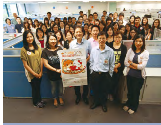
信保局參與「公益金便服日」

信保局參與慈善及義工服務，貢獻社群，矢志肩負企業社會責任。年度內，信保局參加了多項籌款活動，包括「公益金便服日」、「奧比斯中秋慈善義賣」和「扶康會全港賣旗日」等，支援有需要人士。其他善舉包括捐血活動、捐贈舊衣、舊電腦及相關設備予慈善機構。員工熱情投入上述活動，著實令人鼓舞。