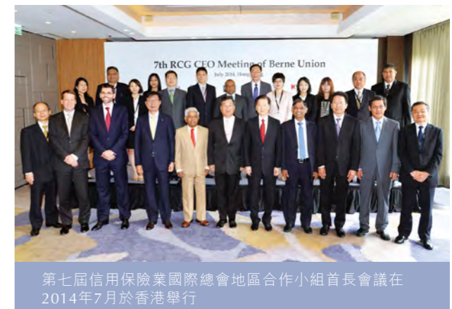
第七屆信用保險業國際總會地區合作小組首長會議在2014年7月於香港舉行

信保局亦在信用保險業國際總會非正式地區合作小組扮演活躍角色。該小組由來自澳洲、中國內地、印度、印尼、日本、馬來西亞、斯里蘭卡、南韓、台灣、泰國及香港的亞太區出口信用保險機構組成。除了參加與信用保險業國際總會會議同期舉行的地區合作小組會議及在印度孟買